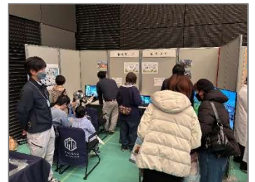
写真1：ブース出展の様子

今後も引き続き地域に密着した活動を続け、地域経済・産業の発展、福祉の増進への寄与を続けていきたいと考えています。