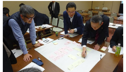
グループディスカッションの状況