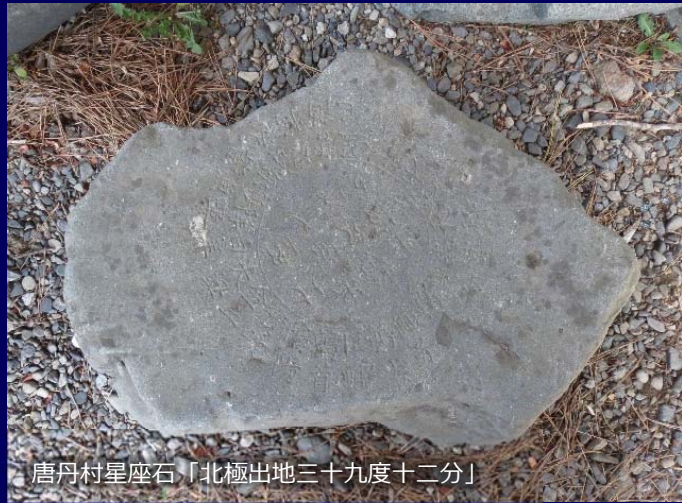
唐丹村星座石「北極出地三十九度十二分」