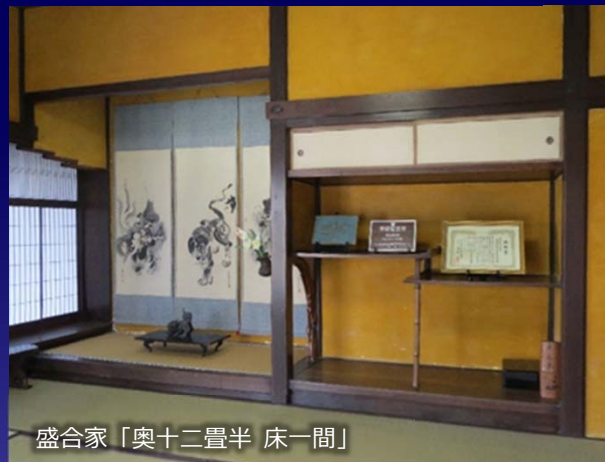
盛合家「奥十二畳半 床一間」